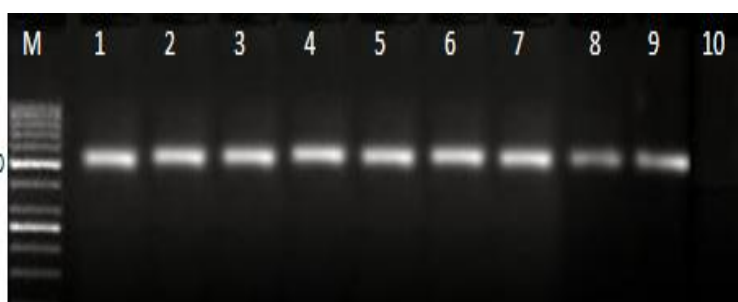
شکل شماره ۲- ژل آگارز ۲٪ مربوط به PCR به‌دست‌آمده از DNA برخی جدایه‌های استرپتوکوکوس اینیایی به‌دست‌آمده از مزارع قزل‌آلای چهارمحال و بختیاری و کهگیلویه و بویر احمد، M = نشانگر، ۱-۸ = جدایه‌های مورد آزمایش، ۹ = کنترل مثبت (استرپتوکوکوس اینیایی GQ8503771)، ۱۰ = کنترل منفی (لاکتوکوکوس گارویه GQ8503761)

است. همچنین، ۷ کارگاه (۱۴٪) از مزارع دو استان در زمان نمونه‌گیری هیچ‌گونه بیماری باکتریایی نداشتند. نتایج این مطالعه نشان می‌دهد که افزون بر بیماری‌های استرپتوکوکوزیس و لاکتوکوکوزیس برخی کارگاه‌های قزل‌آلای این استان‌ها به برخی سپتی سمی‌های باکتریایی دیگر نیز مبتلایند. زیرا در ۶ کارگاه (۱۲٪) استان‌های پیش‌گفته نتایج نمونه‌گیری کشت باکتریایی به جداسازی ایزوله‌های باکتریایی از نوع گرم مثبت و گرم منفی منجر گردید که نیازمند مطالعه‌های بیشتر است.