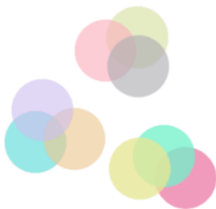
شکل ۳- وجود ثبات درونی و تک‌بعدی بودن مقیاس