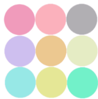
شکل ۲- عدم وجود ثبات درونی و تک‌بعدی بودن مقیاس

لازم به ذکر است نیاز نیست هر آیتم با همه آیتم‌های دیگر واریانس مشترک داشته باشد. Gardner برای نشان دادن ابعاد و ثبات یک مقیاس ۹ آیتمی را طراحی کرد که در شکل‌های شماره ۲-۴ نشان داده شده است (۲۷). در شکل شماره ۲ هیچ‌کدام از آیتم‌ها با سایر آیتم‌ها واریانس مشترک ندارند. به عبارت دیگر، هیچ هم‌پوشانی بین آیتم‌ها وجود ندارد. در این حالت نه ثبات درونی و نه تک‌بعدی بودن مقیاس، وجود ندارد. نتیجه این شرایط یک آلفای کم و عدم وجود تک‌بعدی بودن مقیاس است. در شکل شماره ۳، نشان داده شده است که همه‌ی آیتم‌ها حداقل با سایر آیتم‌ها واریانس مشترک دارند. این نشان دهنده‌ی ثبات درونی بالا و تک‌بعدی بودن مقیاس است. اما در شکل شماره ۴، هر آیتم فقط با برخی از آیتم‌ها واریانس مشترک دارند. این نشان دهنده‌ی ثبات درونی بالا است، اما مقیاس اصلاً تک‌بعدی نیست.