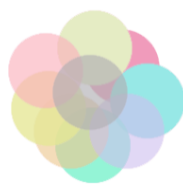
شکل ۴- وجود ثبات درونی و عدم تک‌بعدی بودن مقیاس