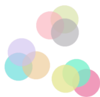
شکل ۳- وجود ثبات درونی و تک‌بعدی بودن مقیاس