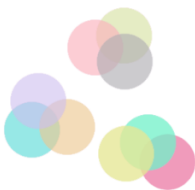
شکل ۳- وجود ثبات درونی و تک‌بعدی بودن مقیاس