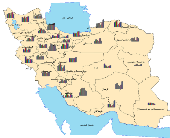
خانوارهای مواجهه یافته با مخارج کمرشکن سلامت (%)