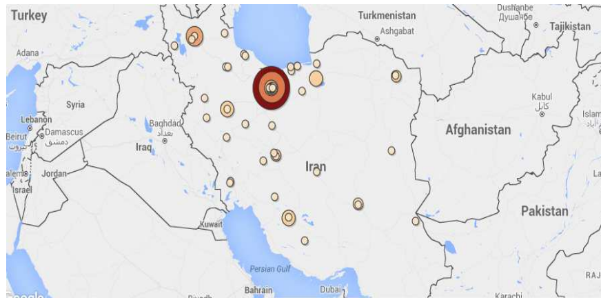
شکل شماره ۵- مصورسازی تولیدات علمی دانشگاه‌های برتر ایران در حوزه اپیدمیولوژی طی سال‌های ۲۰۱۱-۲۰۱۵ میلادی در پایگاه اسکوپوس (اندازه هر گره: تعداد مقاله‌های آن دانشگاه؛ طیف رنگ گره‌ها از زرد به قرمز: میانگین استنادی کم‌تر تا بیش‌تر)