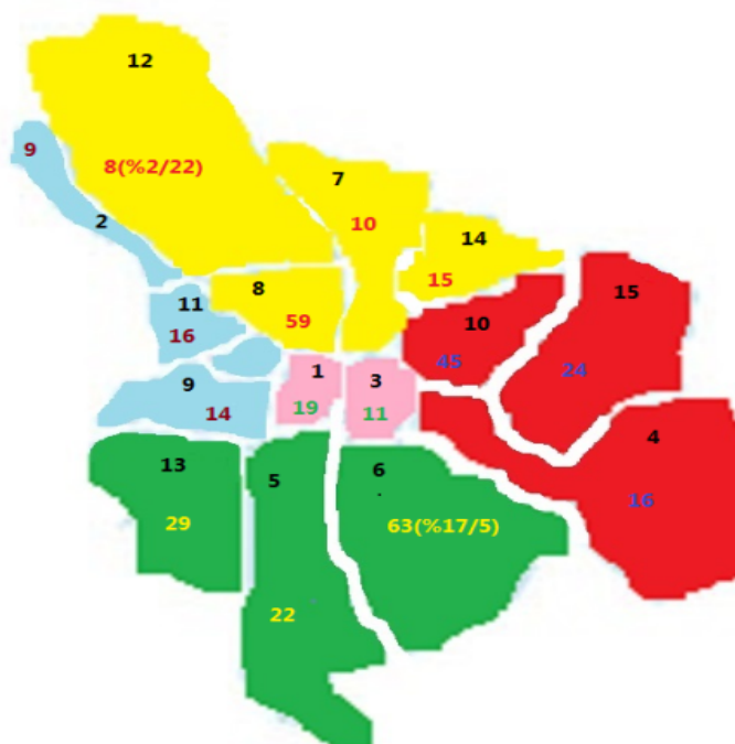
شکل شماره ۱ - توزیع محل سکونت بیماران شناسایی شده در مطالعه مورد- شاهدی همه‌گیری اسهال در شهر اصفهان در بهار ۱۳۹۴ بر حسب حوزه‌ی جغرافیایی و مناطق شهرداری