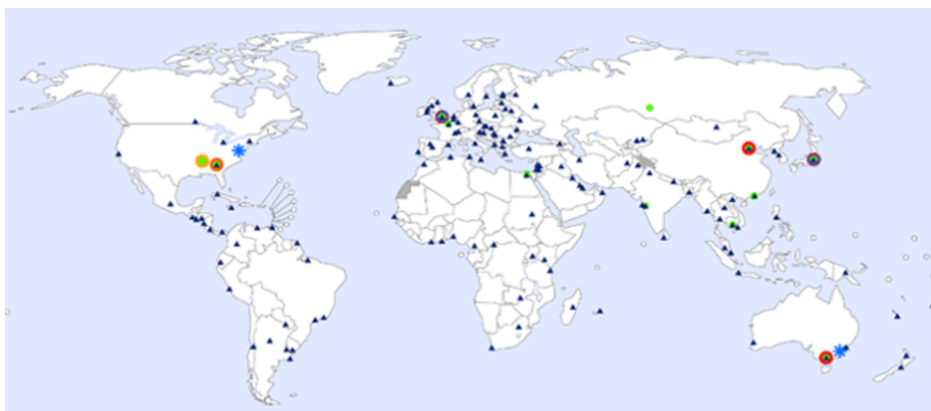
شکل شماره ۱- مراکز همکار سازمان بهداشت جهانی در شبکه جهانی مراقبت آنفلوانزا (۲۴)