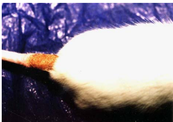
تصویر ۱- موش آلوده، زخم لیشمانیوز پوستی را در محل تلقیح در پایه دم نشان می‌دهد.