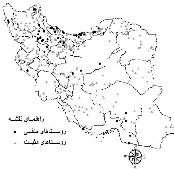
تصویر شماره ۱- نقشه روستاهای نمونه‌گیری شده در سال ۱۳۹۲ در سراسر کشور، دایره‌های تیره روستاهای سرم منفی و مثلث‌های خاکستری روستاهای سرم مثبت را نشان می‌دهد.

* آب و هوای خزری پایه و بقیه با آن مقایسه شده است.