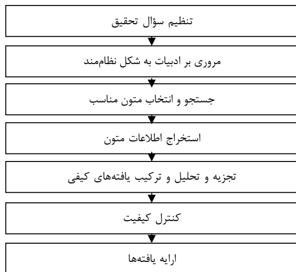
جدول شماره ۲- مراحل پیاده‌سازی روش متاترکیب (۱۹)

بر اساس جدول شماره ۲، مراحل مبسوط پیاده‌سازی روش متاترکیب به شرح زیر می‌باشد: