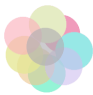
شکل ۴- وجود ثبات درونی و عدم تک‌بعدی بودن مقیاس