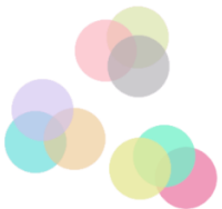
شکل ۳- وجود ثبات درونی و تک‌بعدی بودن مقیاس