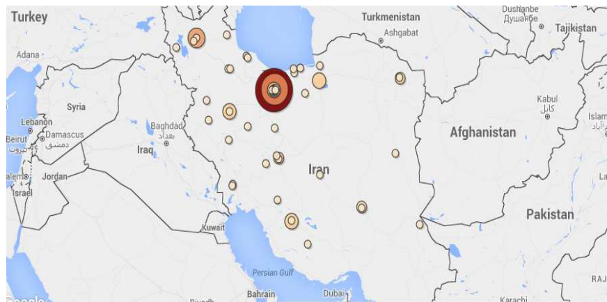
شکل شماره ۵- مصورسازی تولیدات علمی دانشگاه‌های برتر ایران در حوزه اپیدمیولوژی طی سال‌های ۲۰۱۱-۲۰۱۵ میلادی در پایگاه اسکوپوس (اندازه هر گره: تعداد مقاله‌های آن دانشگاه؛ طیف رنگ گره‌ها از زرد به قرمز: میانگین استنادی کم‌تر تا بیش‌تر)