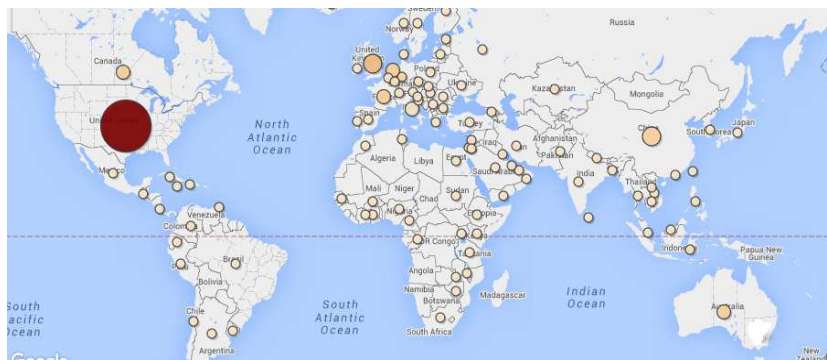
شکل شماره ۱- مصورسازی تولیدات علمی کشورهای جهان در حوزه اپیدمیولوژی طی سال‌های ۲۰۱۱-۲۰۱۵ میلادی در پایگاه اسکوپوس (اندازه هر گره: تعداد مقاله‌های آن کشور؛ طیف رنگ گره‌ها از زرد به قرمز: میانگین استنادی کم‌تر تا بیش‌تر)