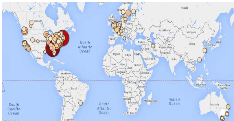
شکل شماره ۳- مصورسازی تولیدات علمی دانشگاه‌های برتر جهان در حوزه‌ی اپیدمیولوژی طی سال‌های ۲۰۱۵-۲۰۱۱ میلادی در پایگاه اسکوپوس (اندازه هر گره: تعداد مقاله‌های آن دانشگاه؛ طیف رنگ گره‌ها از زرد به قرمز: میانگین استنادی کم‌تر تا بیش‌تر)