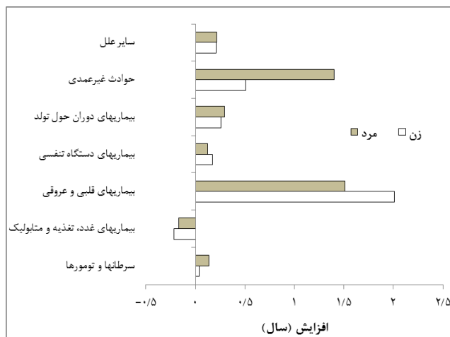
نمودار شماره ۳- سهم علل اصلی مرگ در افزایش امیدزندگی در کشور بر حسب جنس ۱۳۸۵-۹۵