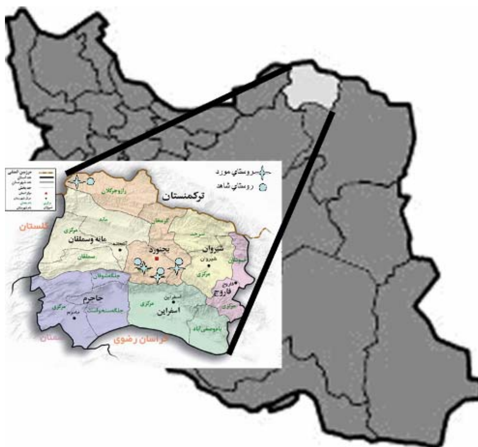
نقشه ۱- موقعیت جغرافیائی شهرستان بجنورد از استان خراسان شمالی و پراکندگی روستاهای تحت مطالعه در این شهرستان

سگ‌ها پس از بررسی، با ژن ITS1 لیشمانیا اینفانتوم به شماره Accession NO:EU326227/1 ثبت شده در بانک ژنی مربوط به مرکز بین المللی اطلاعات بیوتکنولوژی (NCBI)، به میزان ۹۹٪ شباهت داشت. این ایزوله‌ها با شماره‌های EU810776 و EU810777 در بانک ژن مذکور ثبت گردیدند.