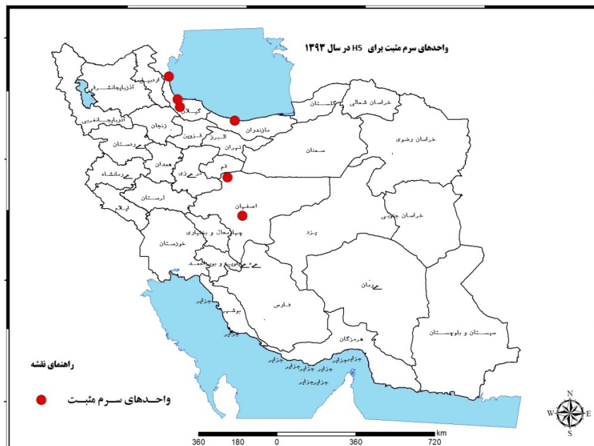
شکل شماره ۲- واحدهای سرم مثبت برای آنفلوانزای H5 در سال ۱۳۹۳