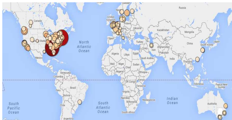
شکل شماره ۳- مصورسازی تولیدات علمی دانشگاه‌های برتر جهان در حوزه‌ی اپیدمیولوژی طی سال‌های ۲۰۱۵-۲۰۱۱ میلادی در پایگاه اسکوپوس (اندازه هر گره: تعداد مقاله‌های آن دانشگاه؛ طیف رنگ گره‌ها از زرد به قرمز: میانگین استنادی کم‌تر تا بیش‌تر)