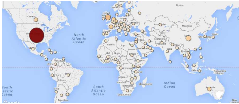
شکل شماره ۱- مصورسازی تولیدات علمی کشورهای جهان در حوزه اپیدمیولوژی طی سال‌های ۲۰۱۱-۲۰۱۵ میلادی در پایگاه اسکوپوس (اندازه هر گره: تعداد مقاله‌های آن کشور؛ طیف رنگ گره‌ها از زرد به قرمز: میانگین استنادی کم‌تر تا بیش‌تر)