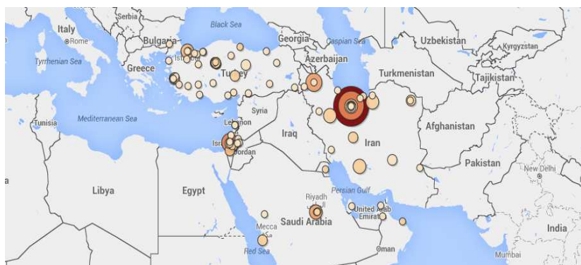
شکل شماره ۴- مصورسازی تولیدات علمی دانشگاه‌های برتر خاورمیانه در حوزه‌ی اپیدمیولوژی طی سال‌های ۲۰۱۱-۲۰۱۵ میلادی در پایگاه اسکوپوس (اندازه هر گره: تعداد مقاله‌های آن دانشگاه؛ طیف رنگ گره‌ها از زرد به قرمز: میانگین استنادی کم‌تر تا بیش‌تر)