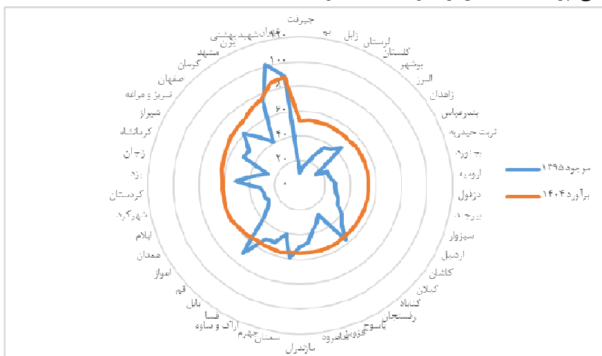
نمودار شماره ۱ - نسبت پزشک متخصص به ازای ۱۰۰۰۰۰ نفر جمعیت در سال ۱۳۹۵ و ۱۴۰۴ در دانشگاه‌های علوم پزشکی کشور

۵۹٪ در سال ۱۳۹۵ به ۱۹٪ در سال ۱۴۰۴ خواهد رسید. همچنین در سال ۱۴۰۴ دانشگاه‌های علوم پزشکی لرستان (۴۰٪)، تهران (۳۰٪)، ایران (۲۸٪)، سبزواری و کرمان (۲۷٪) بیشترین میزان پراکندگی پزشک متخصص را خواهند داشت و دانشگاه‌های شهرکرد و یزد (۱٪)، زابل و جیرفت (۴٪) و ارومیه (۵٪) کمترین میزان پراکندگی پزشک متخصص را خواهند داشت.