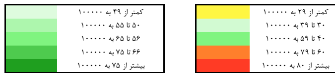
شکل شماره ۱- وضعیت توزیع نسبت تخت به ازای ۱۰۰۰ نفر جمعیت در استان‌های ایران در سال ۱۳۹۵ و برآورد ۱۴۰۴