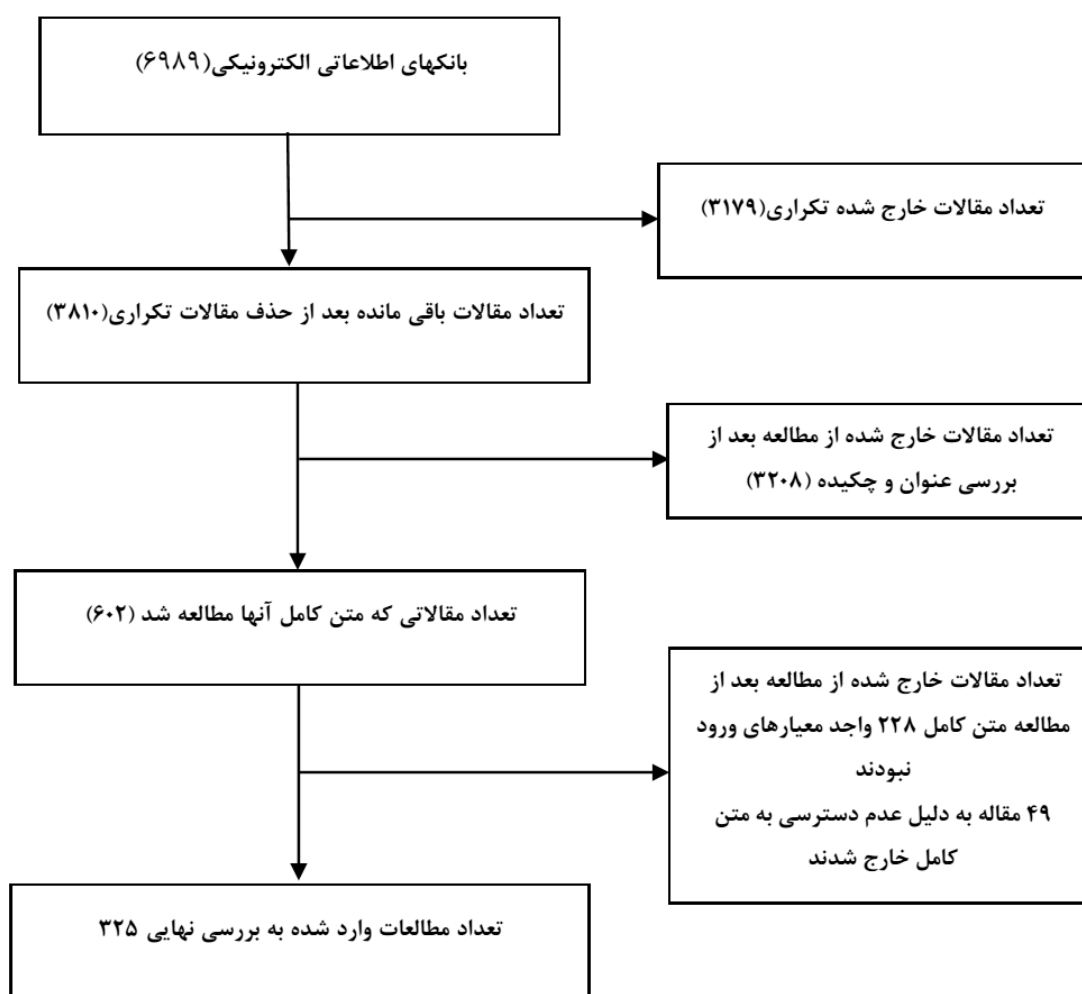
شکل شماره ۱- فلوچارت فرایند انتخاب مقاله‌ها در مرور ساختاریافته سطح پوشش واکسن پنوموکوک

کونژوگه ۱۳ ظرفیتی پنوموکوک که شامل: B, 9V, 14, 18C, 6,4, 19F, 23F, 1, 5, 7F, 3, 6A, 19A غیراختصاصی واکسن کونژوگه ۱۳ ظرفیتی پنوموکوک شامل سروتایپ‌های F,15A/B,35B, 11A۸,۱۲ تقریباً در تمامی مناطق مشترک هستند. البته اختلافاتی از نظر شیوع سروتایپ هر منطقه با منطقه دیگر وجود دارد. سروتایپ‌های شایع استرپتوکوک پنومونیه به ترتیب شیوع، در کشورهای دریافت‌کننده، پس از دریافت واکسن به تفکیک مناطق