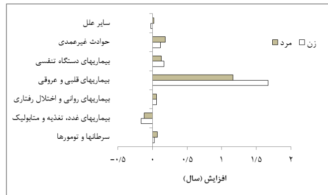
نمودار شماره ۴- نقش سنین سالمندی در افزایش امیدزندگی در کشور به تفکیک علل اصلی مرگ بر حسب جنس، ۱۳۸۵-۹۵