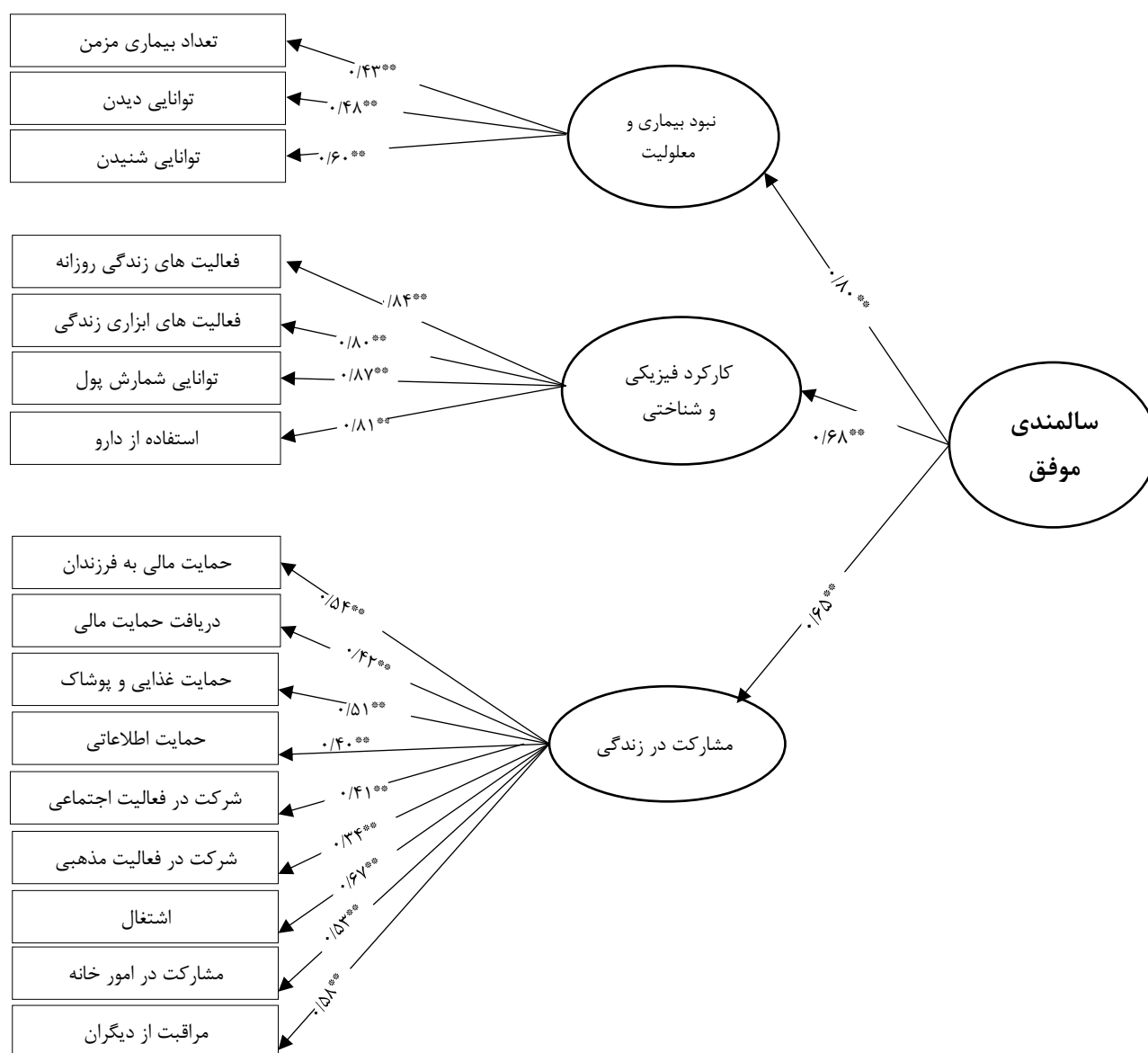
شکل شماره ۲- مدل تجربی سالمندی موفق روو و کان در مردان سالمند شهر تهران (حجم نمونه= ۳۰۹)

نتیجه همه شاخص‌های برازش در میان مردان حاکی از تایید مدل و تطبیق آن بر اساس مدل نظری روو و کان دارد. شکل ۲ نشان می‌دهد که در مدل سالمندی موفق مردان نیز در بعد نبود بیماری و معلولیت، بار عاملی برای توانایی شنیدن (۰/۶۰) در مقایسه با تعداد بیماری مزمن و توانایی دیدن (۰/۴۸) و (۰/۴۳) بالاتر است. بررسی بارهای عاملی در بعد حفظ عملکرد فیزیکی و شناختی نشان داد که به مانند مدل کل، بارعاملی برای فعالیت توانایی شمارش پول بالاتر از سایر متغیرهاست اما در این بعد برخلاف مدل کل، دومین بار عامل بالا مربوط به متغیر فعالیت‌های زندگی روزانه (۰/۸۴) است. در بعد مشارکت در زندگی نیز مدل مردان تفاوت‌های چشمگیری با مدل کل دارد. در این بعد بیشترین بارعاملی مربوط به متغیر مشاهده شده