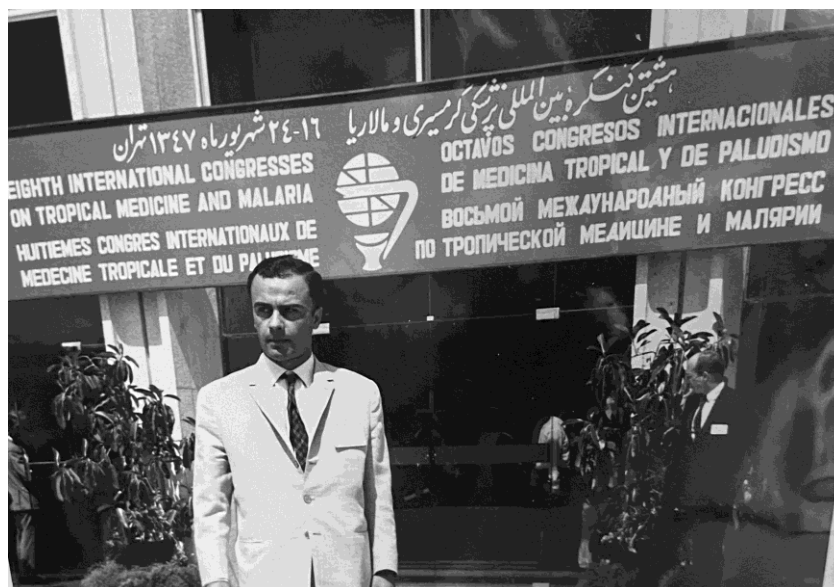
شکل شماره ۲- دکتر حسین صباغیان در هشتمین کنگره بین المللی پزشکی گرمسیری و مالاریا، تهران، سال ۱۳۴۷

اجرای برنامه پژوهشی در زمینه «گسترش آلودگی‌های کرمی» در ایران شرکت داشت (۵). ایشان در دانشکده بهداشت دانشگاه تهران مسئولیت‌هایی نظیر ریاست ایستگاه تحقیقات بهداشتی اصفهان (شکل ۳)، اجرای برنامه‌های پژوهشی در مورد بروسولوز، و بیماری‌های انگلی، و دبیر دفتر تحقیق دانشکده بهداشت (به مدت تقریبی دو سال) را به عهده داشت.