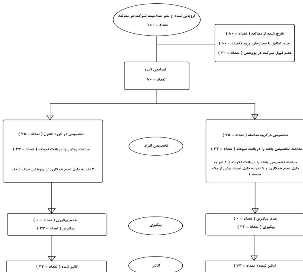
نمودار شماره ۱- نمودار کانسورت مطالعه