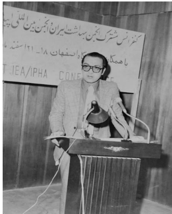
تصویر ۳- سخنرانی در کنفرانس مشترک انجمن بهداشت ایران و انجمن بین المللی اپیدمیولوژی، اصفهان ۱۳۵۵

برنامه ایمن سازی کودکان در سطح کشور اصول مدیریت و انجام عملیات ایمن سازی را فرا گرفتند. مدیر بخش بهداشت مرکز نشر دانشگاهی (۱۳۶۶-۱۳۶۰): ایشان در این سمت، مدیریت و نظارت بر انتخاب و انتشار کتاب های حوزه علوم بهداشتی را به عهده داشت و مجموعه واژگان بهداشت عمومی، که بوسیله انجمن بهداشت ایران منتشر شد و انتشار نسخه فارسی مجله