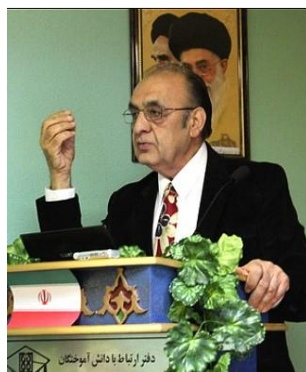
تصویر ۵- سخنرانی در زمینه جنبه های گسترده دانش همه گیری شناسی در دانشکده بهداشت، دانشگاه علوم پزشکی تهران ۱۳۹۰