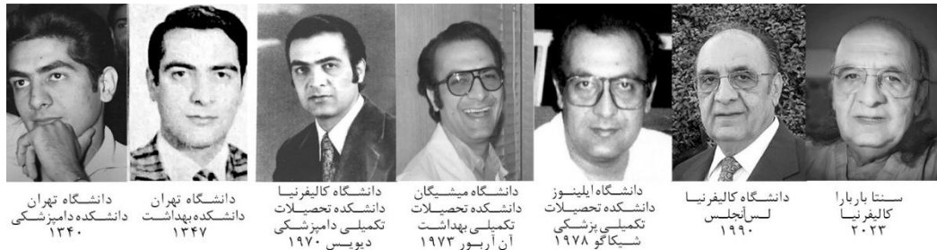
تصویر ۱- دکتر کیومرث ناصری در گذر زمان